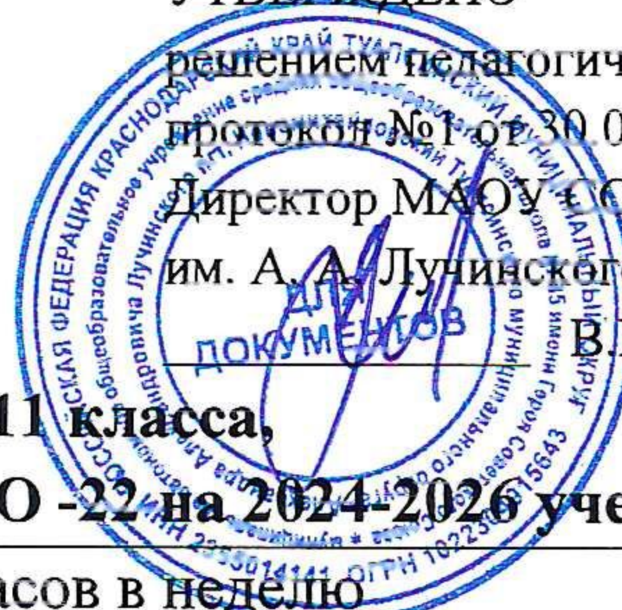
Таблица-сетка часов учебного плана 10- 11 класса,

социально-экономического профиля реализующих ФГОС СОО -22 на 2024-2026 учебный год